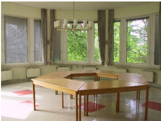
De ronde kamer, omgeven door groen