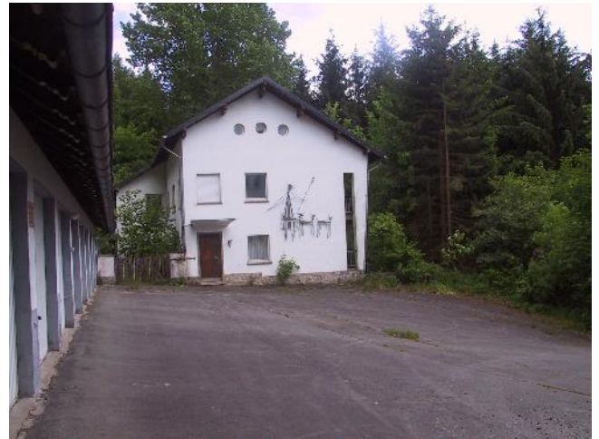
Grote woning en garages, parkeerplaats

In de kelderetage is er een kleine sauna.