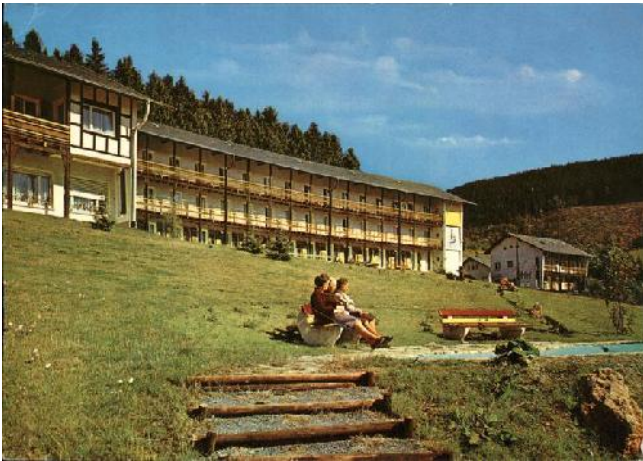
Zicht op de 3 etages van het slaapkamergebouw, met ernaast de grote woning.